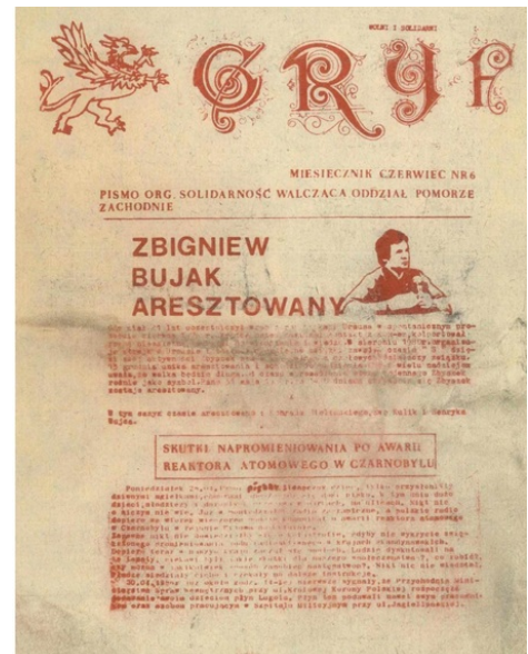
Grif. Pismo organizacji Solidarność Walcząca Oddział Pomorze Zachodnie nr 6 z czerwca 1986 r., IPN By 463/112, s. 63-74